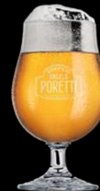
Scatola di bicchieri (*)